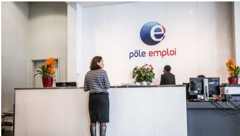
Siège de Pôle emploi (Paris XXe). « Plusieurs milliers de postes de cadres du service public de l'emploi sont dans le viseur de Bercy. »

Le gouvernement envisage de réaliser trois milliards d'économies en cinq ans sur le budget du service public de l'emploi. A la clé, notamment, des milliers de suppressions de postes.